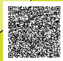
Mapa de espacios para denuncias sobre violencias basadas en géneros (VBG)

Escanea el código QR para acceder al MAPA